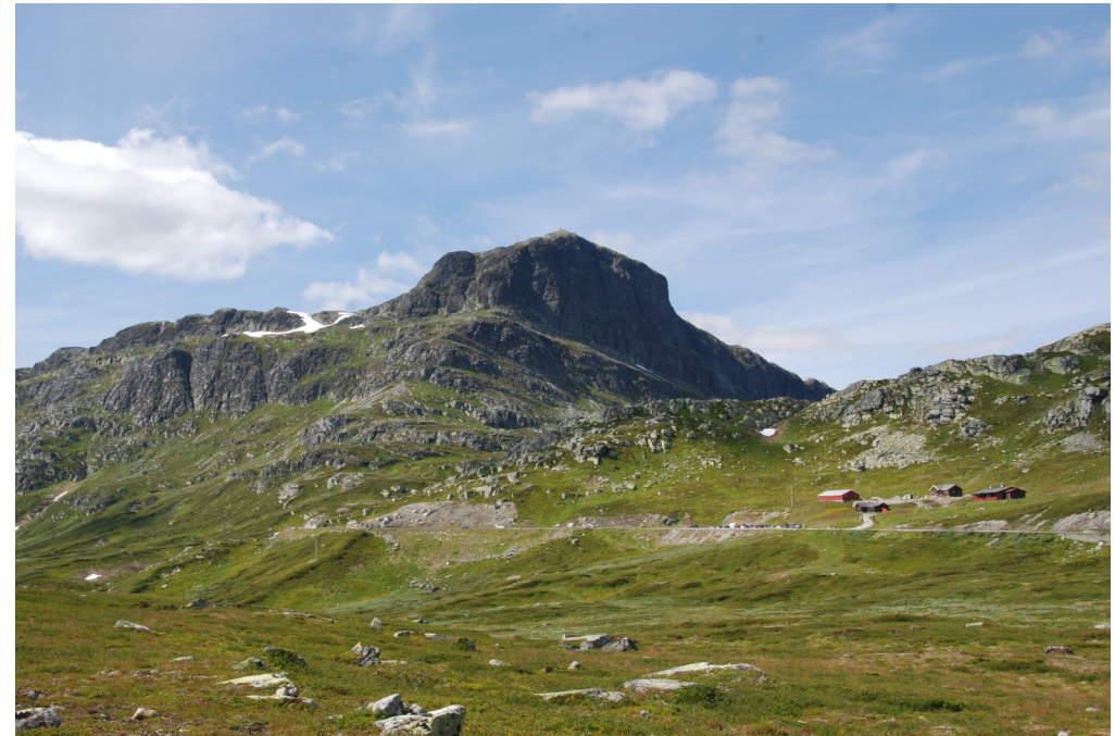
Bitihorn er eit av turmåla i år.

Alder: _____ (for dei under 11 år). Innsendingsfrist er 18. oktober